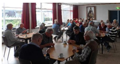
Kaarten bij KBO Terhole.